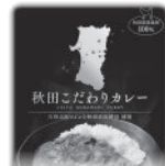
新商品開発パッケージ支援