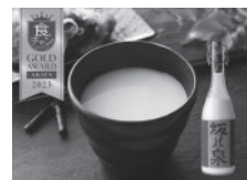
新商品・改良商品のコンテスト支援