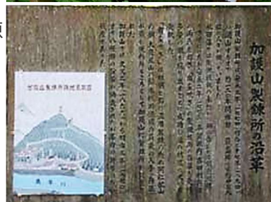
加護山製錬所の沿革