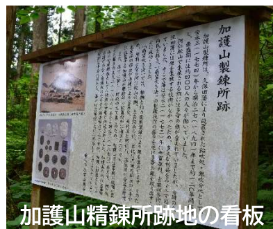
加護山精錬所跡地の看板