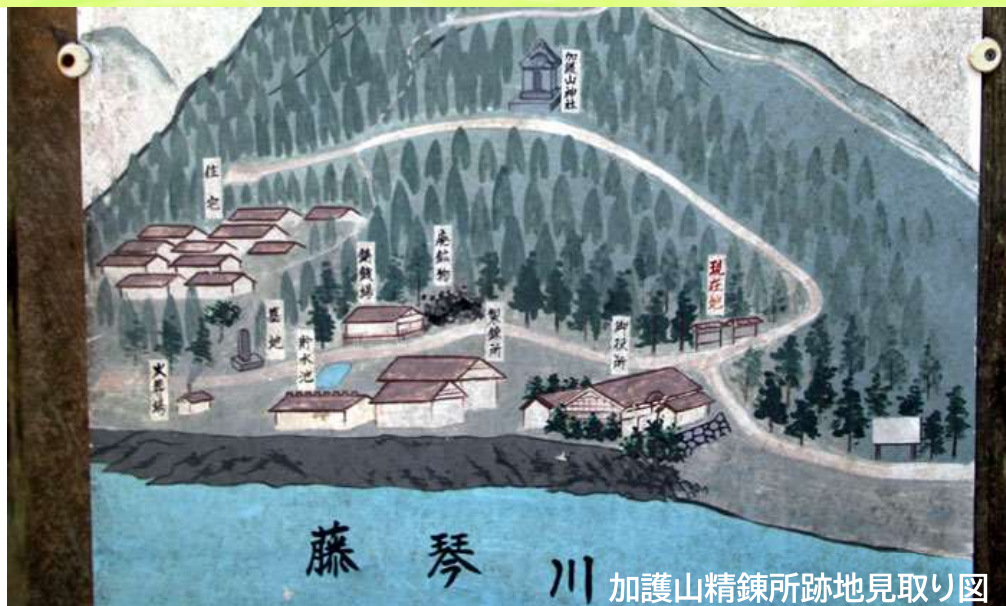
藤琴川 加護山精錬所跡地見取り図