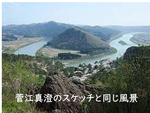
菅江真澄のスケッチと同じ風景