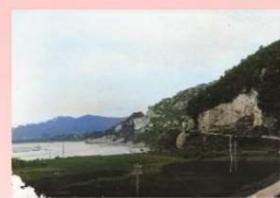
左：時期不明 上：AIによりカラー化した画像 ※AIで再現された色は正確ではありません

きみまち阪やニツ井町の昔の写真をお持ちの方はご連絡ください！カラー、モノクロ、ネガフィルムなんでも結構です。一度お預かりし、スキャンしてお返しいたします。