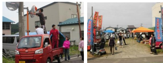
6/9 青年部・女性部クリーンアップや 6/28 軽トラ市

45歳までの経営者・後継者が加入する「青年部」、事業に携わる女性が加入する「女性部」では、資質向上のための研修会やイベントを開催するなどして、地域のネットワークが広がります。