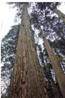
至 仁鮎・きみまち杉